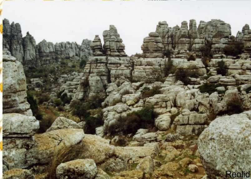
PARQUE NATURAL EL TORCAL