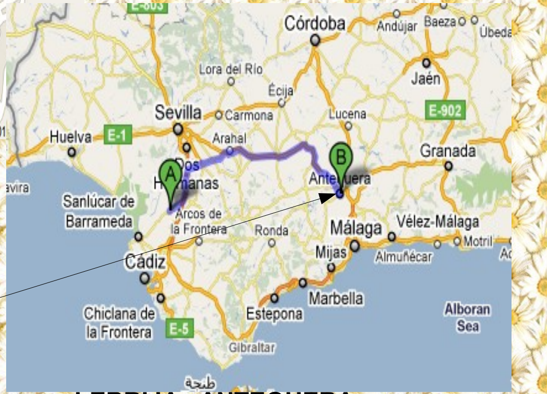
LEBRIJA - ANTEQUERA