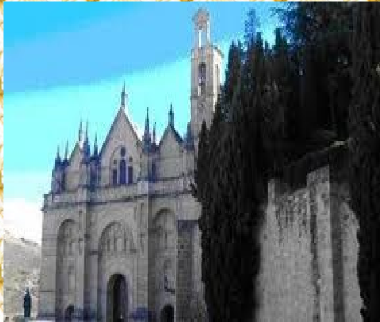
COLEGIATA DE SANTA MARÍA