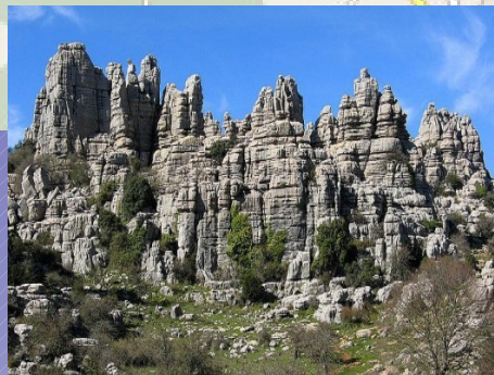
Parque natural El Torcal