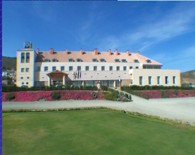
HOTEL ANTEQUERA GOLF