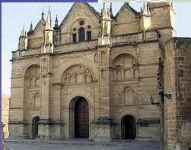
COLEGIADA DE SANTA MARIA